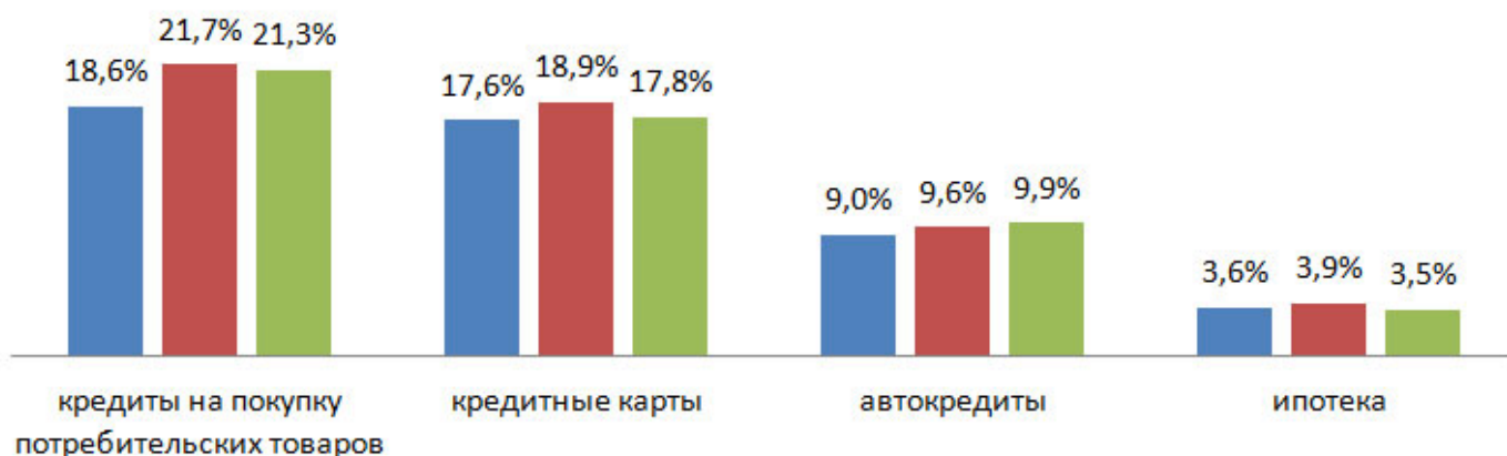
Диаграмма 1. Динамика просроченной задолженности свыше 30 дней по видам розничным кредитов в 2018-2019 гг.

■ январь-февраль 2016 ■ 4 кв. 2016 ■ январь-февраль 2017