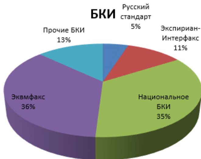
Рисунок. 2 Распределение долей БКИ по количеству кредитных историй

По этим данным видно, что на рынке кредитных историй продолжится консолидация путем поглощения мелких БКИ крупными. Интересным для изучения и анализа представляется информация о продуктах и услугах, которые реализуют на рынке БКИ. Сегодня на рынке БКИ предлагают следующие продукты: кредитный отчет; скоринг; мониторинг событий кредитной истории на основе триггеров; противодействие мошенничеству; базы данных по залогу. Кредитный отчет является наиболее востребованным продуктом, предлагаемым БКИ. Стоимость кредитного отчета для банка может составить от 7 до 20 руб.